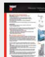
Filtración hidráulica LT36182