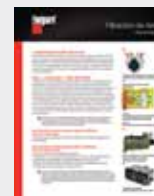
Filtración de Aire LT36178