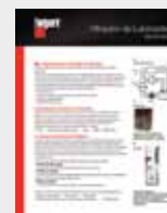
Filtración de lubricante LT36180