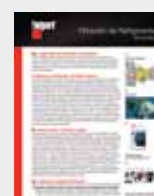
Filtración de Refrigerante LT36181