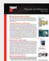
Filtración de Refrigerante LT36181