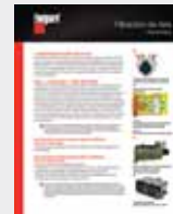
Filtración de Aire LT36178