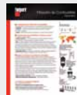
Filtración de combustible LT36179