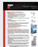
Filtración hidráulica LT36182