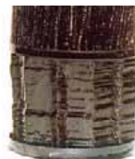
Sedimentos: Del 75% al 90% de los contaminantes presentes en el aceite lubricante son orgánicos (= sedimentos)