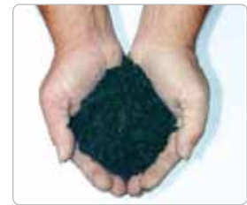
1 gramo de polvo "ingerido" por el motor por CV del motor sería suficiente para destruirlo