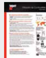
Filtración de combustible LT36179