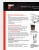
Filtración de lubricante LT36180