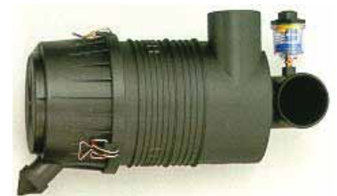
Sistema de filtración de aire de dos etapas, que incluye un indicador de restricción para entornos con mucho polvo