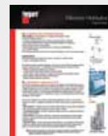
Filtración hidráulica LT36182