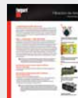
Filtración de Aire LT36178