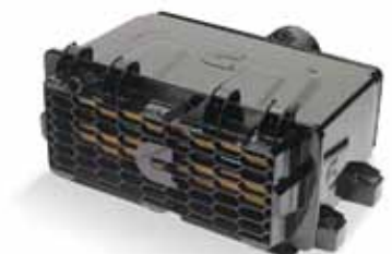
Tecnología de vanguardia: Sistema de filtración de aire Direct Flow™