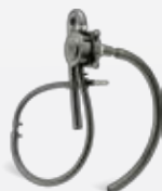
Ventilação Aberta do Cárter