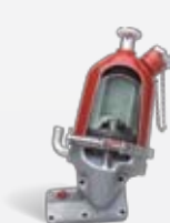
ConestaC Filtração Centrífuga

Nossa tecnologia de última geração em sistemas e componentes de admissão de ar atende ou excede todas as especificações dos OEM globais para máximas qualidade e performance. Materiais compostos avançados, ótima eficiência e projeto com economia de espaço tornam os Produtos Fleetguard OptiAir™ e Direct Flow™ perfeitos para os modernos compartimentos de motores onde o espaço é valioso.