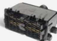
Filtração Direct Flow Air Com Mídia de Nano fibra